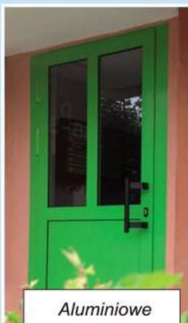
Aluminiowe drzwi spawane