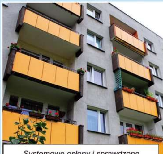
Systemowe osłony i sprawdzone balustrady balkonowe