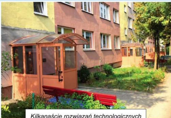
Kilkaście rozwiązań technologicznych WIATROLAPÓW samonośnych