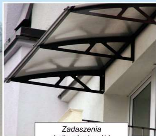
Zadaszenia balkonów i wejść