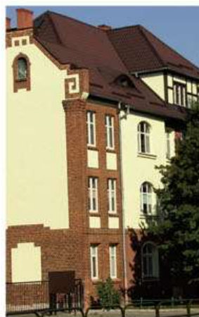
AWP – najstarszy budynek