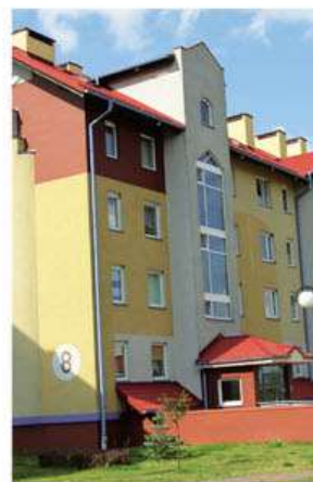
Os. Piastów – jeden z najnowszych budynków

tlice, lokale handlowe, usługowe, administracyjne itp.