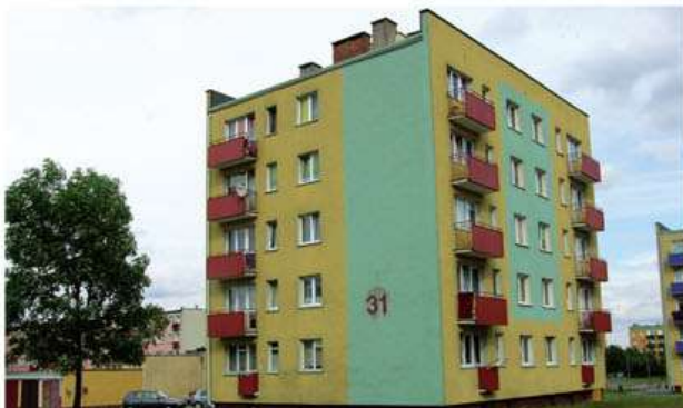
Nasze największe osiedle - os. Kopernika

mieszkań, o ogólnej powierzchni 290.136 m 2 . W pozostałych 79 budynkach mieszczą się lokale użytkowe, w tym: 59 zespołów garażowych z 602 garażami, Spółdzielczy Dom Kultury, świe-